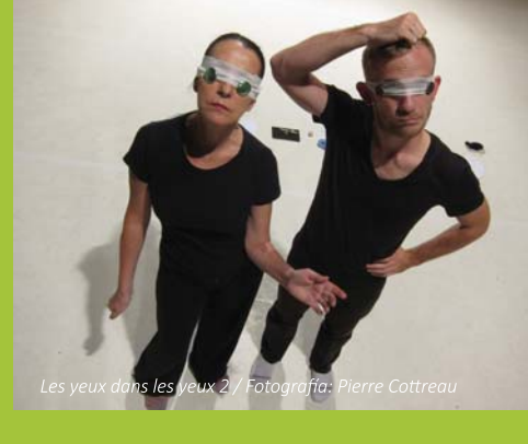
Les yeux dans les yeux 2