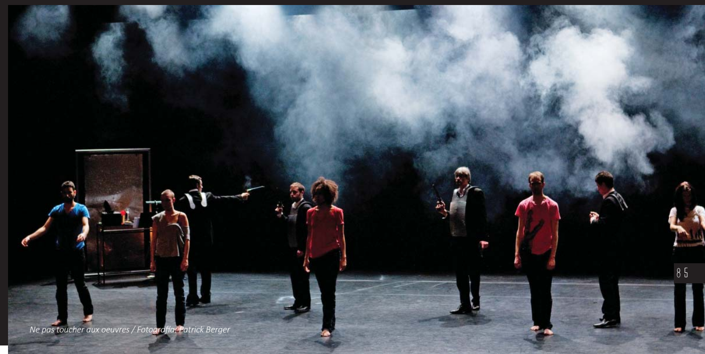
Ne pas toucher aux œuvres

Nous n'avons ni méthode préétablie, ni mode d'emploi. Juste un processus de recherche. Heuristique? Expérimental? Dialectique? Il ne faut pas nier le poids du contexte: on n'est pas seul dans son atelier, créant. On cherche, on s'active, on juxtapose la concentration sur son travail et la perception du monde tout autour.