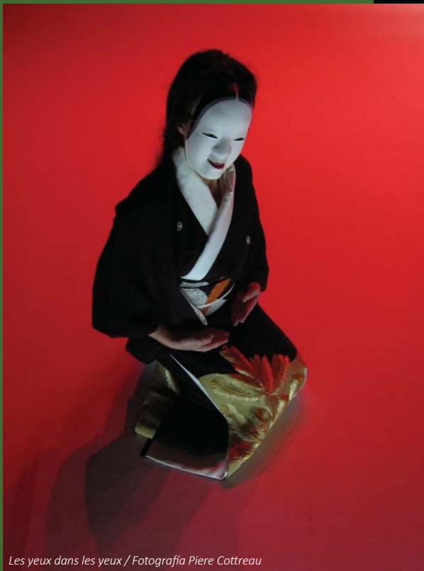
Les yeux dans les yeux