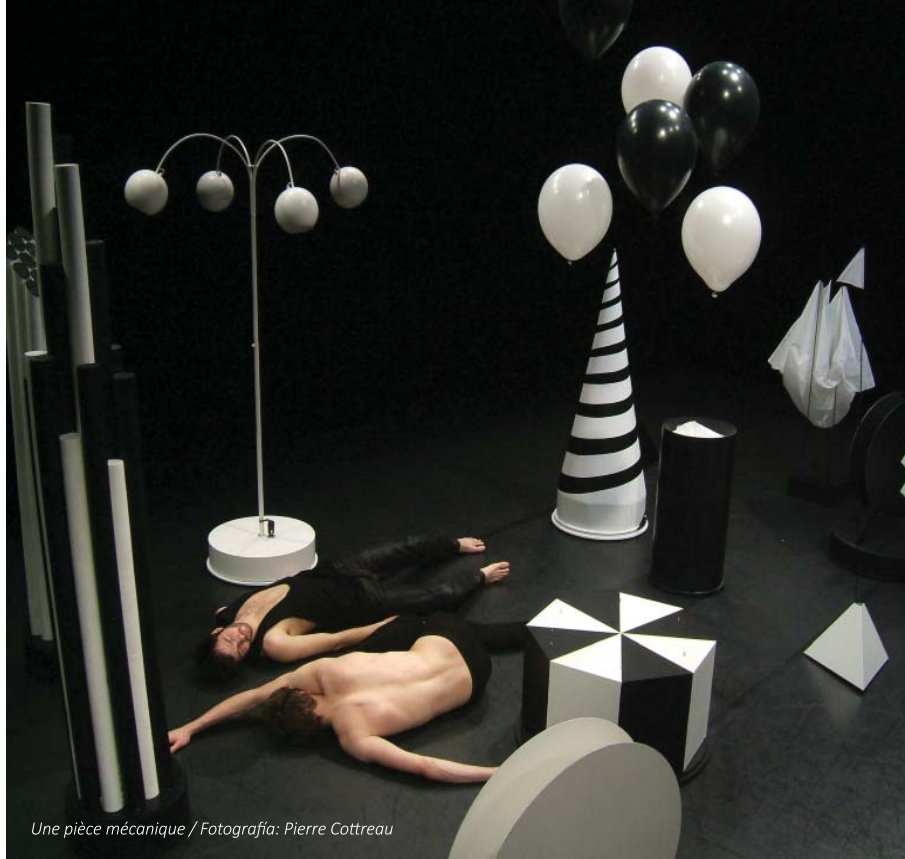
Une pièce mécanique

Interesarnos en los procesos artísticos de artistas que no son coreógrafos es muy estimulante para nosotros; las obras de directores de cine, artistas visuales, escritores, y filósofos, son fuertes puntos de apoyo. Somos artistas trabajando en el campo de la danza. Pero el primer compromiso es el del arte, es por eso que nos gusta colaborar con otros artistas.