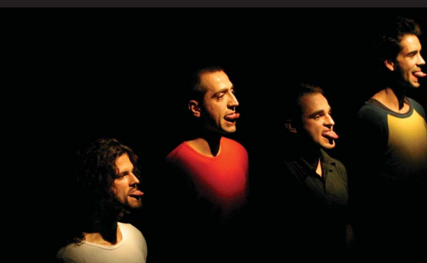
Lex 2

Trop penser nuirait à la danse. Nous revendiquons de trop penser comme de trop danser. Nietzsche posait cette question: crée-t-on à partir de l'excès ou à partir du manque? L'art est toujours excessif, parce qu'il excède son contexte. Nos créations favorisent avant tout l'art du lancement de la pièce de monnaie. Cette dernière roule sur un bord et peut tomber sur pile ou sur face. Nos créations sont du spectacle – elles ne sont ni un essai théorique, ni une production commerciale. Sont-elles de la danse? Sont-elles de l'art?