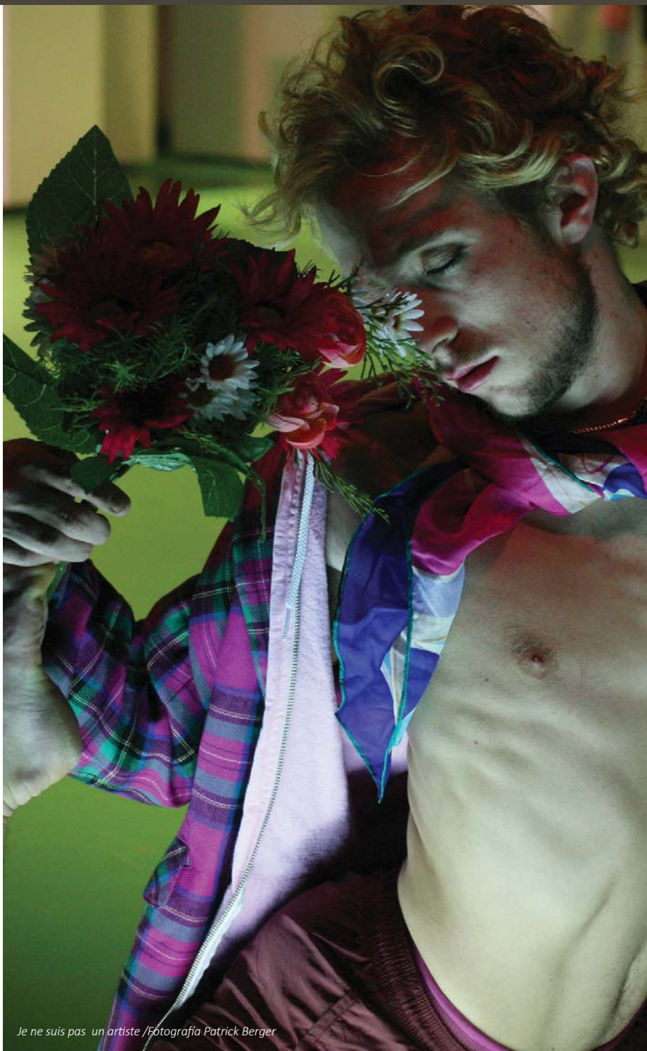
Je ne suis pas un artiste