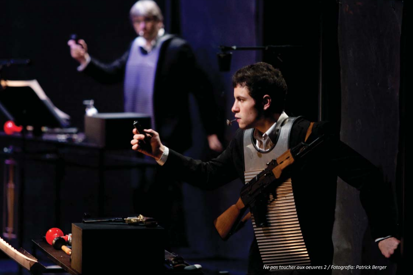
Ne pas toucher aux oeuvres 2