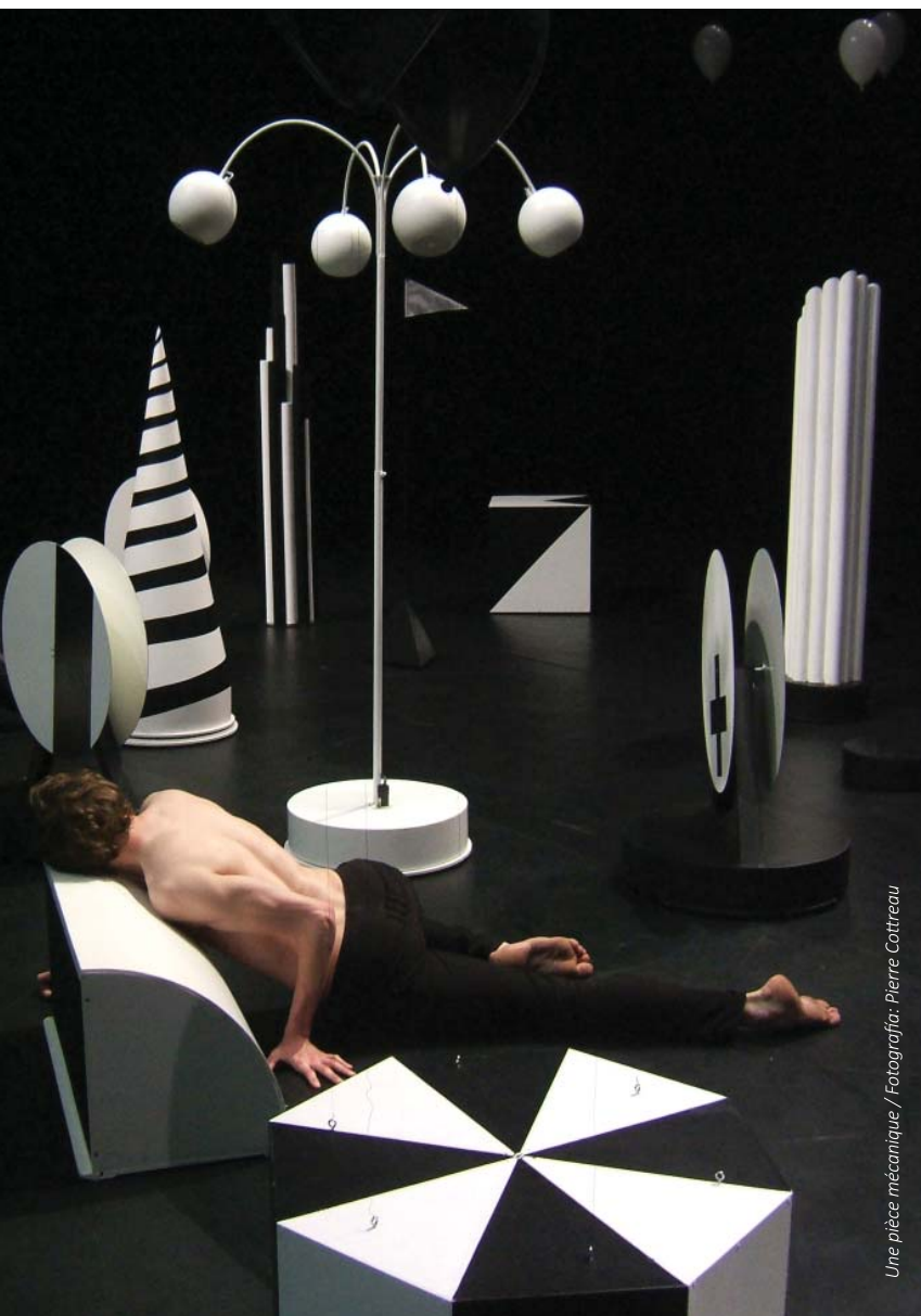
Une pièce mécanique