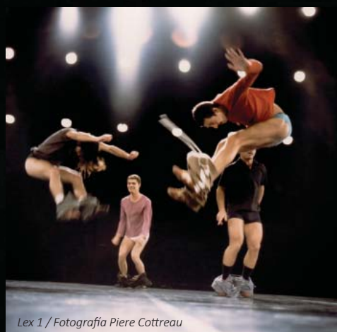
Lex 1