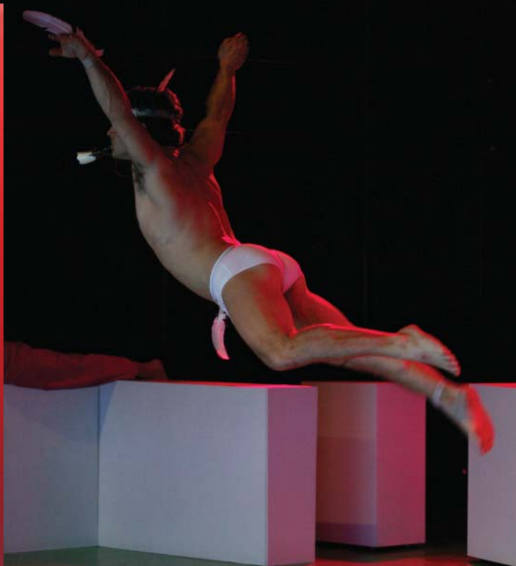
Je ne suis pas un artiste