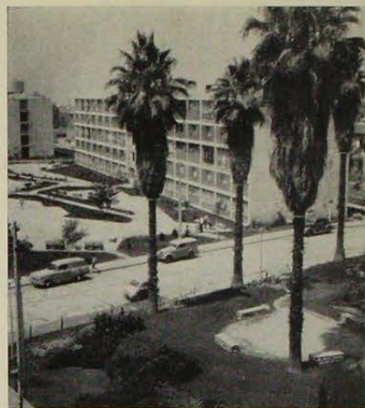
Acceso desde Providencia. - La Plaza de las Palmeras.