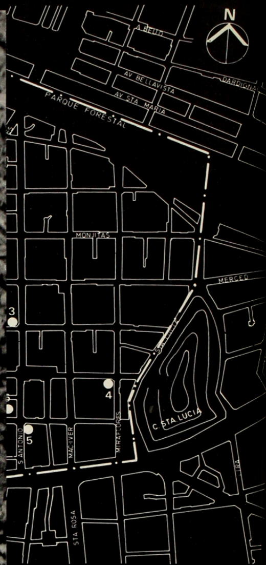
Ampliación de fotografía F.: 380086