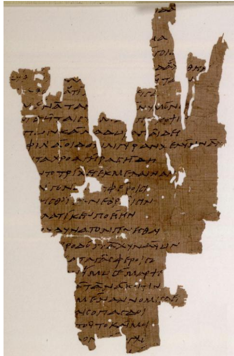
P. Oxy. 1787.

La fuente conocida del fragmento 58 era un papiro hallado en las excavaciones realizadas por Grenfell y Hunt entre 1896 y 1907 en la antigua ciudad egipcia de Oxirrinco, hoy El-Bahnasa, provincia de Minia (Grenfell y Hunt, 1914). Este papiro, el P. Oxy. 1787 fr. I, contiene 26 líneas en el cual, como hemos confirmado ahora, hay fragmentos de tres poemas.