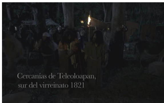
Figura 1: Capítulo "La patria es primero".

informa que lo narrado no ocurre en un espacio vago, sino en un lugar específico del actual Estado de Guerrero, donde se libraron las luchas más largas de la independencia, en un tiempo en el que estaba a punto de terminar la guerra (1821). Con ello, la producción de la serie situó el proceso en una geografía específica.