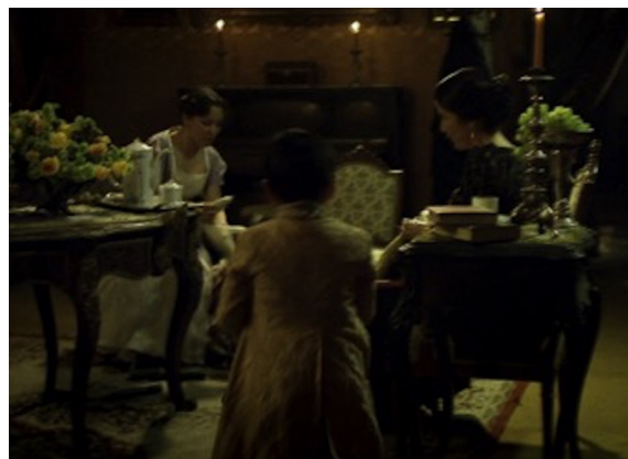
Figura 3: Capítulo 2 “Las conspiraciones de Josefa”, Gritos de muerte y libertad .