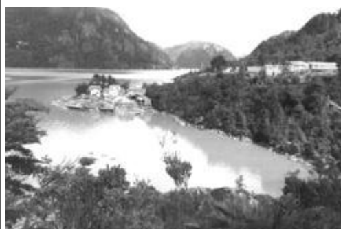
Caleta Tortel, P.Hartmann, 1982. ©