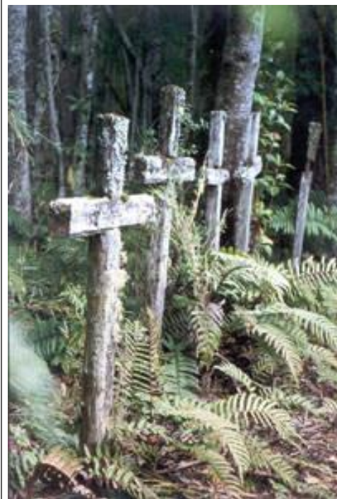
Isla Muertos, P. Hartmann ©