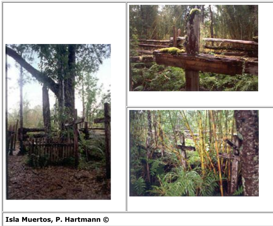
Isla Muertos