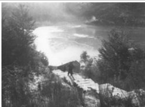
Fondo de la ensenada de Caleta Tortel, congelada durante el invierno de 1982, después de una semana de escarcha, P. Hartmann., 1982. ©