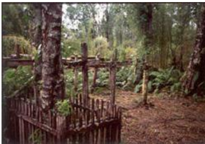
Isla Muertos, P. Hartmann ©