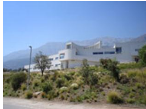
Figs.10.- y 11.- Campus Peñalolén Universidad Adolfo Ibáñez: Crecimiento volúmenes exentos a riesgo de desvirtuar condición de claustro precordillerano. Cruz Ovalle y arquitectos asociados.