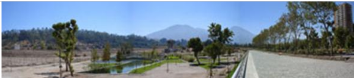
Fig. 22.-Parque Bicentenario: etapa espacio público Centro Cívico, Fernández Larrañaga y equipo.