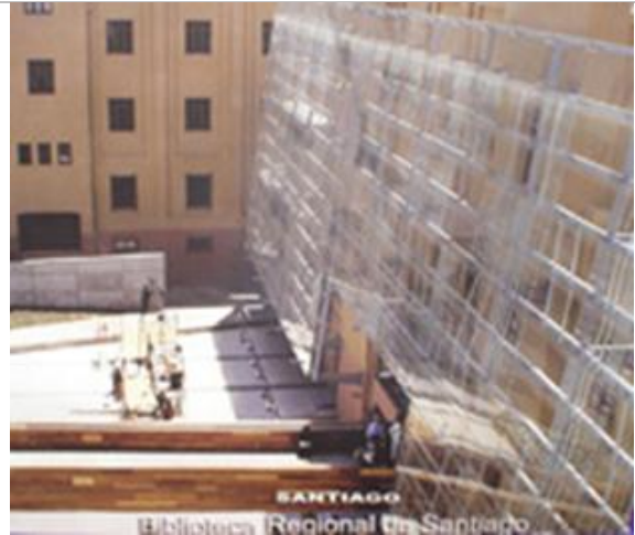
Figs. 12.- y 13.- Biblioteca Regional de Santiago: Remodelación de un antiguo edificio de abastecimiento. La función única de biblioteca atenta para su uso público permanente de la Plaza Urbana frente al Centro Matucana 100. Cox, Ugarte y Córdoba arquitectos.