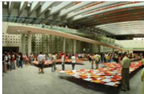
Figs.6.- y 7.- Plaza de La Ciudadanía y Centro Cultural Palacio La Moneda: Espacio colectivo bajo la Plaza de la Ciudadanía, Undurraga Devés Arquitectos.