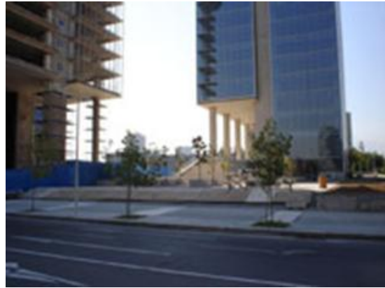
Figs. 29.- y 30.- Paseo Boulevard Centro de Negocios Nueva Las Condes - Javier Aránguiz Pinto (Fotos JAP)