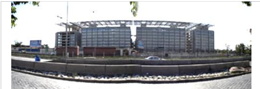
Fig.5.- Ciudad Judicial de Santiago: Conjunto edificatorio Anillo Interior, Boza Díaz+Vila Arquitectos.

Intentando marcar una topología del fenómeno urbano a partir de la relación de las obras de arquitectura e infraestructura ligadas a la conformación del espacio público, se agrupa aquí una nueva serie de proyectos que intentan avanzar en los ejes planteados en el proceso de refundación y consolidación del paisaje urbano de Santiago de Chile.