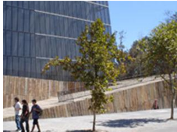
Figs.8.- y 9.- Edificio Centro de Excelencia Docente, Campus San Joaquín, PUC.

Campus San Joaquín UC: Edificio Centro Docente. La alta demanda por nueva superficie edificada en San Joaquín ha planteado la necesidad de densificar en una tipología de planta pequeña. La envolvente queda dissociada con la estructura portante del edificio, ya que la regularidad interna de pilares y losas es trastocada en la expresión externa transparente, sutilmente cortada en dos tonos. El basamento se extrema en una doble rampa y patio inglés, recubierto con materialidad gruesa y de mínima terminación. Aravena Mori-Serex PUC.