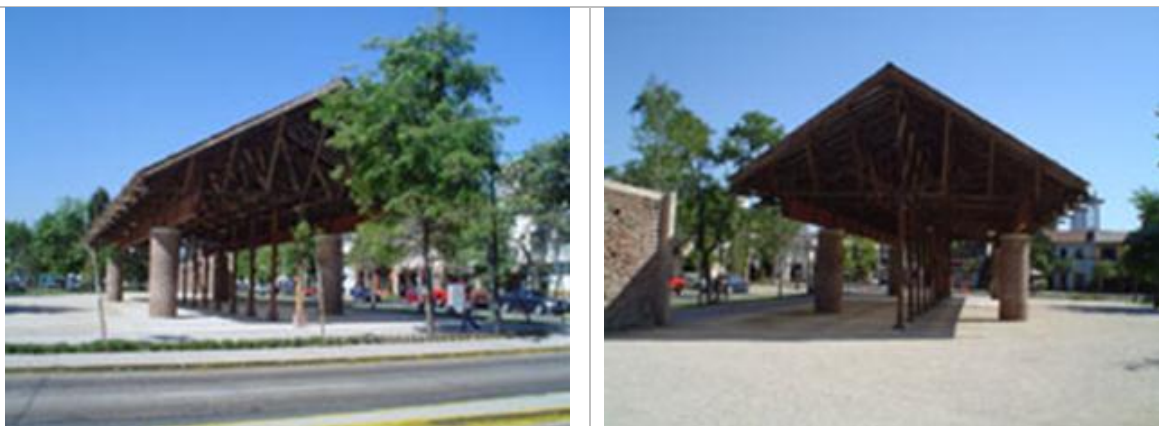
Figs. 23.- y 24.- Plaza Bellavista-Pio Nono: nueva plaza con estructura cubierta. (Fotos JAP)