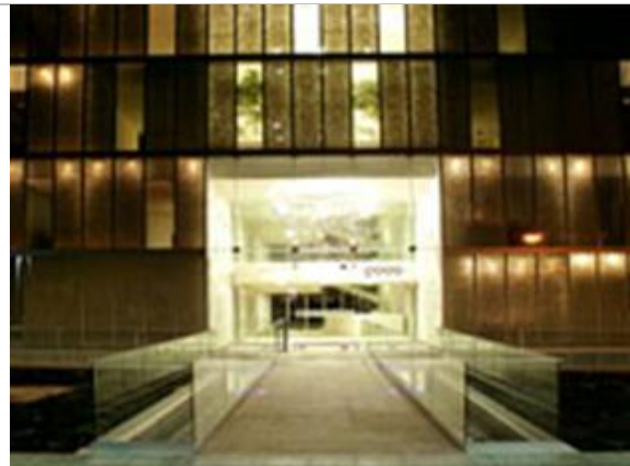
Figs.18.- y 19.- Edificio Simonetti: edificación corporativa Simonetti, Undurraga Devés Arquitectos.