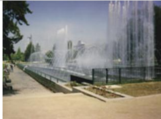
Figs. 25.- y 26.- Fuente Bicentenario: nuevo proyecto de juegos de agua, Parque Providencia.