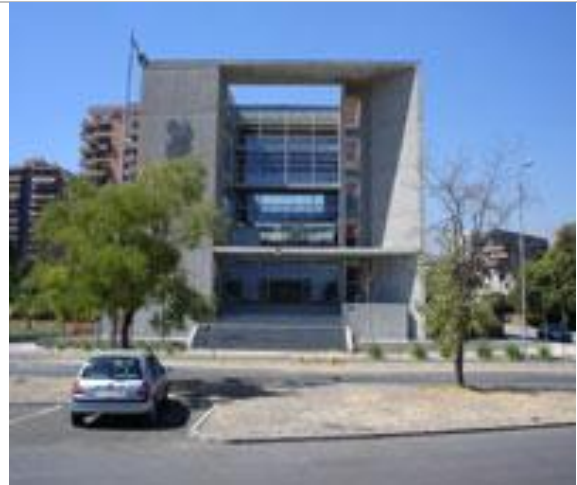
Figs. 16.- y 17.- Edificio de la O.I.T: consolidación del “organismos internacionales”. Dentro de un prisma mínimo, se perfora para ganar vistas cruzadas, aún con el pie forzado de elevarlo por sobre el nivel de la calle. Boza-Díaz e Iglesias/Prat arquitectos.