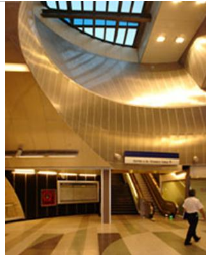
Figs. 27.- y 28.- Estaciones de Metro Línea 4: pabellones transparentes como nuevo acceso.