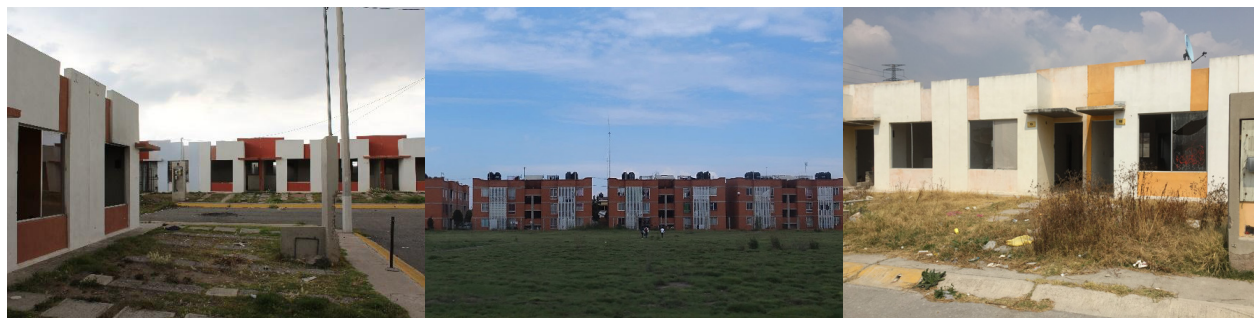
Figura 2 Conjuntos urbanos en los municipios de Zumpango y Huehuetoca

Nota. A la izquierda, conjuntos habitacionales en Zumpango; a la derecha en Huehuetoca.